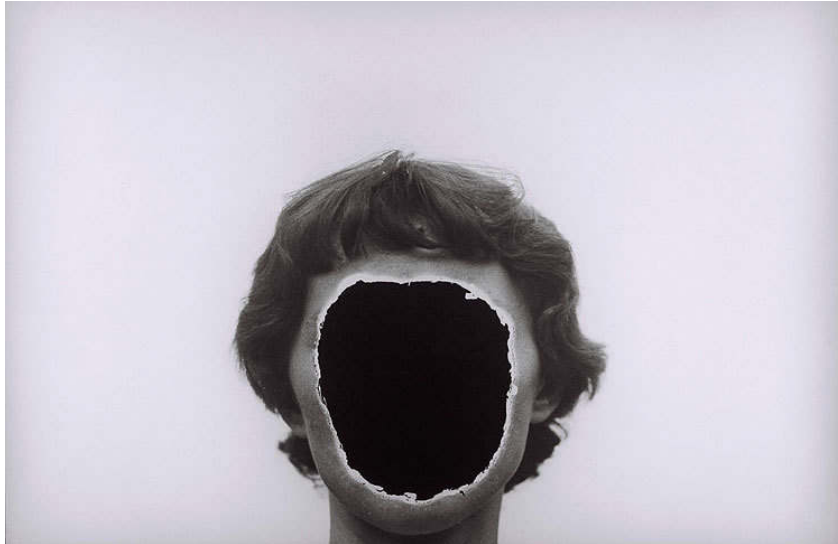
Portret żony, 1956-1957