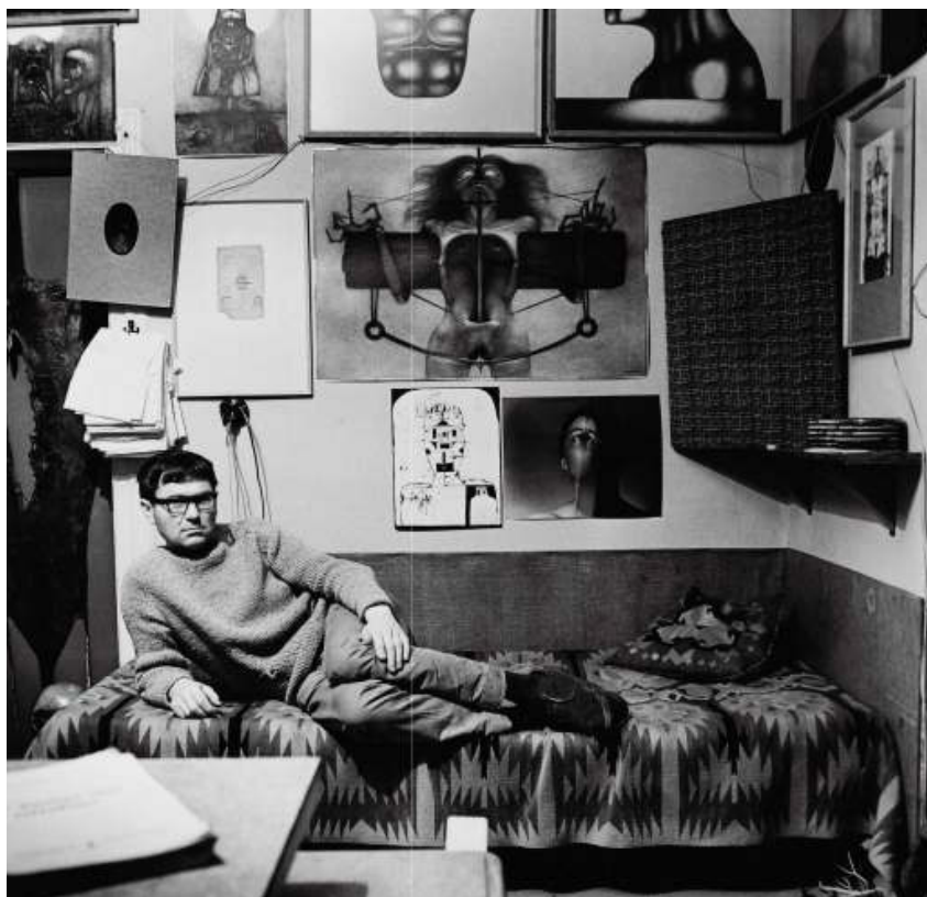
Zdzisław Beksiński w pracowni. Fotografia zamieszczona w albumie Foto Beksiński , wydawnictwo Bosz, 2011