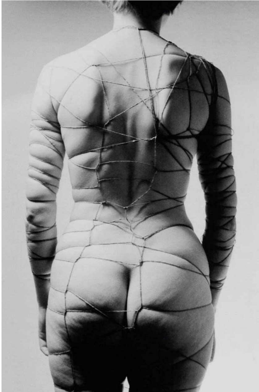
Study for the Sadist's Corset 3, lata 50.

Książka Grzebałkowskiej ma jeszcze jedną warstwę, fascynującą nie tylko dla miłośników twórczości Beksińskiego. Otóż śledząc losy głównego bohatera, poznajemy świat sztuki schyłku PRL-u i pierwszej dekady demokracji. To doskonale uzupełnienie dominującego dziś obrazu, który składa się z epokowych dzieł, uznanych nazwisk (Libera, Kozyra, Bałka...), koturnowych legend (jak ta o sztuce krytycznej) i głośnych wystaw. Tymczasem nie sposób dostrzec całej złożoności życia artystycznego doby transformacji bez wypieranego rewersu: starych-nowych elit, które kompetencje kulturowe wyniosły jeszcze z poprzedniego ustroju, dzikiego rynku sztuki, reklamówek pełnych gotówki (tak samo wypieramy „szczęki”, łóżka polowe i bazary), w końcu – społecznego i medialnego uwielbienia dla twórców takich jak Beksiński czy Jerzy Duda-Gracz. 2005 rok to koniec pewnej epoki: umierają wtedy Oskar Hansen i Jerzy Jarnuszkiewicz. Ale również śmierć Beksińskiego