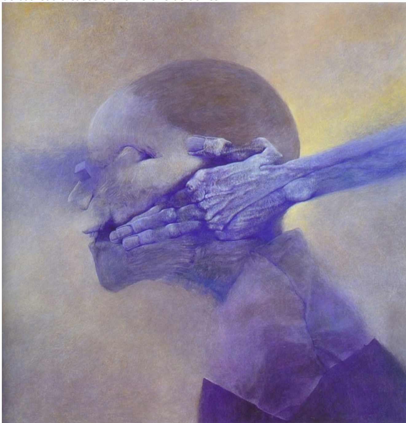
ArtbeksinshalloweenMUSEUM TVmuseumtvtableaux halloweenZdzisław Beksiński

de couteau à cause d'une histoire de dettes.