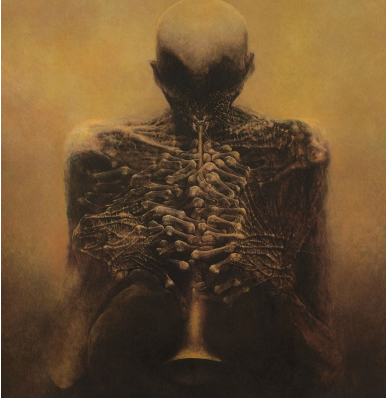
The Horn Player © Beksinski

« Je tiens à peindre comme si je photographiais mes rêves.