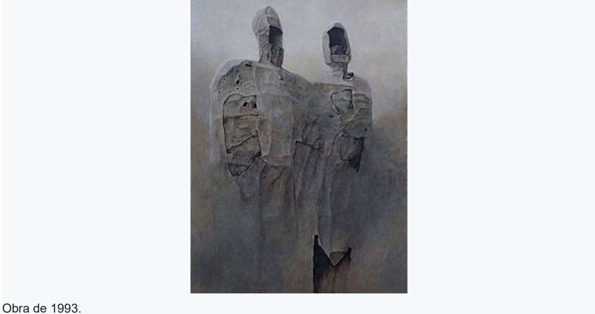
Obra de 1993.

En 1964, una prestigiosa exhibición en Varsovia probó ser su primer éxito, pues todas las pinturas fueron vendidas. Beksinski se arrojó de lleno en la pintura, y trabajó prolíficamente en esta actividad (siempre al son de música clásica). Pronto se convirtió en la figura líder del arte contemporáneo polaco. En los tardíos años sesenta, incursionó en lo que el mismo llamó su “ periodo fantástico ”, en el que duró hasta mediados de la década de los ochenta. Este es su periodo más conocido, durante él creó imágenes perturbadoras, mostrando un mundo surrealista y post-apocalíptico, pormenorizando escenas de muerte, putrefacción, paisajes repletos de calaveras, figuras deformadas y desiertos. Estas pinturas fueron bastante detalladas, demostrando su marcada precisión y perfeccionismo. Al tiempo Beksínski expresaba, “ Deseo pintar de la misma forma como si estuviese fotografiando los sueños ”.