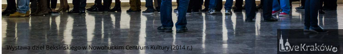
Wystawa dzieł Beksińskiego w Nowohuckim Centrum Kultury (2014 r.)