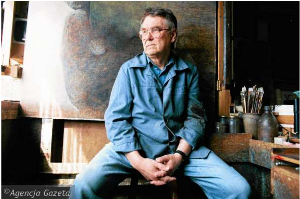
Zdzisław Beksiński w 1996 roku (WOJCIECH DRUSZCZ)