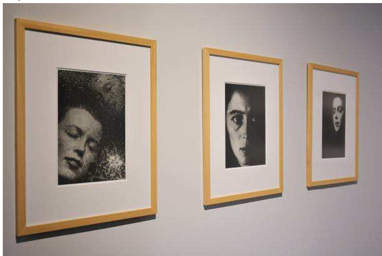
Wystawa 'Zdzisław Beksiński. Granice realności' w Miejskiej Galerii Sztuki

- Orowadzania po wystawach cieszą się uznaniem - kompetentny komentarz, nawiązywanie dialogu, wspólnota zainteresowań zwiedzających składają się na dobrą atmosferę wspólnych wypraw w świat sztuki współczesnej. To przede wszystkim zachęta do rozwijania zainteresowań sztuką, a wiadomości o autorze i wskazówki interpretacyjne mogą jedynie pomóc w odbiorze wystawy - przypomina Miejska Galeria Sztuki.